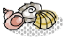
To są muszelki.....