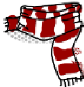
To jest szalik.....