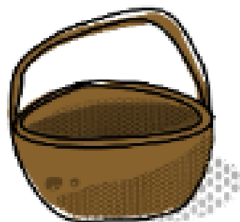
To jest koszyk.....